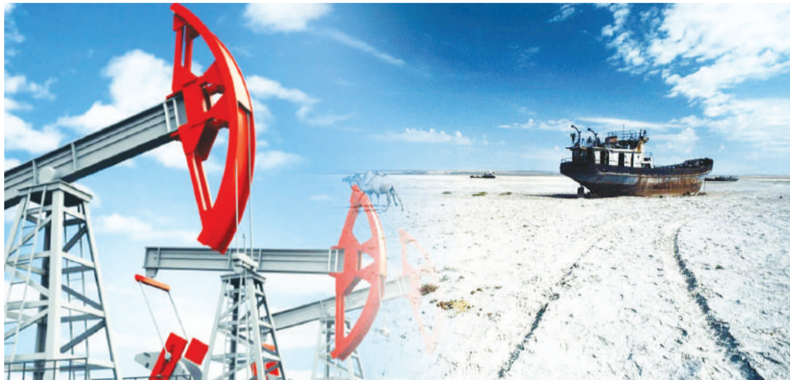
Еллар ҚАБА (коллаж)

Осыдан он жылдан астам уақыт бұрын Арал теңізі табанында қара алтынның мол қоры бар деген қауесет желдей есіп кетті. Елімізде игеріліп жатқан мұнай қорының таусылуға жақын қалғаны мамандарды алаңдатып, жаңа кен орнын іздеуге бет бұрды. Теңіз ұлтанын зерттеген арнайы мамандар мұнайдың мол қорын іздеп жатқанын жалпақ жұртқа жария етті. Бірақ нәтижесі қалай болды?