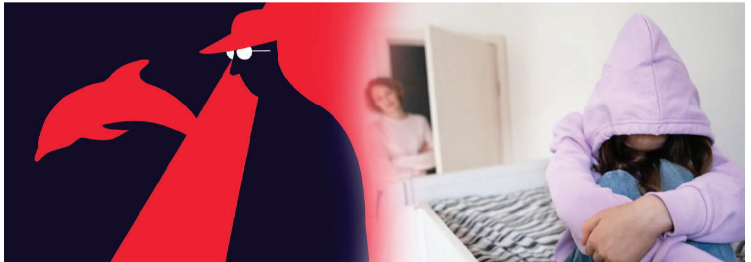
Е. ШАР ҚАБА (КОЛЛАЖ)

қаю, жарылыс ұйымдастыру секілді түрлі заңға қайшы әрекеттер де бар. Егер қатысушы тапсырманы орындаудан бас тартқан жағдайда отбасына, туыстарына зиян келетіні жайлы айбат көрсетіледі екен.